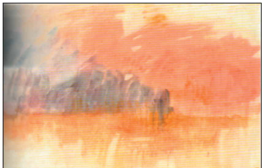
Coucher de soleil, 1840

6. Qu'est-ce que le romantisme? C'est une façon particulière d'exprimer, à travers l'art, ses sentiments profonds. La musique romantique donne souvent envie de pleurer. Beethoven ou Schubert sont des compositeurs romantiques très célèbres.