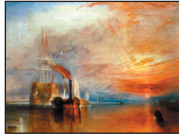
Navire de guerre, 1838

11. En 1802, Turner séjourne à Genève d'où il part pour découvrir les Alpes. De ce voyage, il ramène quelques-unes de ses plus belles toiles. Comme sur le bateau au milieu de