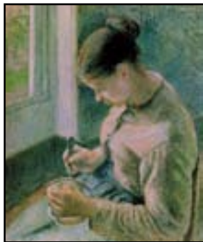
Le café, 1881

5. Pissarro est un bon père de famille. Il a six enfants qu'il a bien du mal à nourrir tous les jours. Mais il leur apprend à peindre. Quatre d'entre eux seront peintres. Avec sa famille, il s'installe à Pontoise, près de Paris, en 1872. Sa maison est toujours pleine d'amis. La plupart sont peintres. C'est là qu'il décidera un jeune peintre amateur, Paul Gauguin, à tout abandonner pour se consacrer entièrement à la peinture.