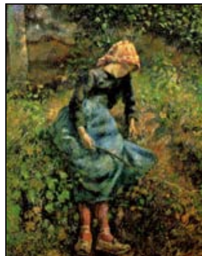
Jeune fille à la baguette, 1881

8. Pissarro reconnaît que cette manière donne beaucoup de pureté. Mais il trouve aussi que cette technique des petits points est ennuyeuse. Pissarro revient donc à sa première manière de peindre.