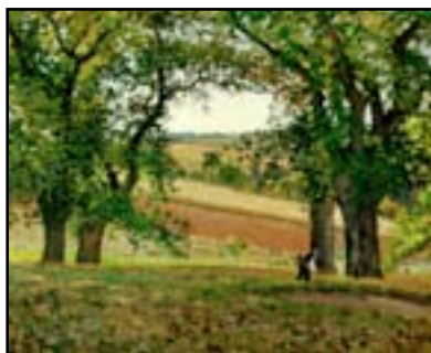
Les châtaigners, 1873

6. Pissarro se dépense sans compter pour organiser les huit expositions impressionnistes, essayant de convaincre, sans cesse, les uns et les autres, d'y participer. Il sera le seul à n'en manquer aucune. Sans se lasser, Pissarro peint tous les paysages autour de Pontoise, en toutes saisons.