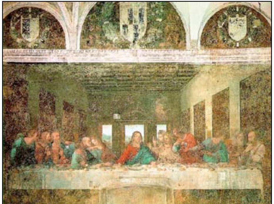
La Cène, 1498