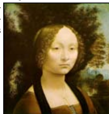
Ginevra de Benci, 1474

7. Qui est cette femme ? Les historiens pensent qu'il s'agit du portrait d'une certaine Lisa qui, en 1495, avait épousé Francesco del Giocondo, un marchand de Florence. Le nom du marchand au féminin donna Gioconda , la Joconde en français. La célébrité infinie de ce tableau provient d'abord de son sourire, un sourire énigmatique qui jamais n'a pu être imité.