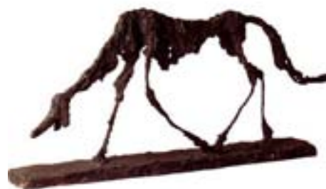
Le chien, 1961

3. Alberto Giacometti est né en 1901 dans une famille d'artistes suisses du Tessin. Son père, Giovanni Giacometti, était un peintre impressionniste. Au Tessin, il n'y a pas d'école de peinture alors Alberto s'inscrit à l'école des Beaux Arts de Genève où il apprend à dessiner, à peindre et à sculpter. En 1922, il se rend à Paris.