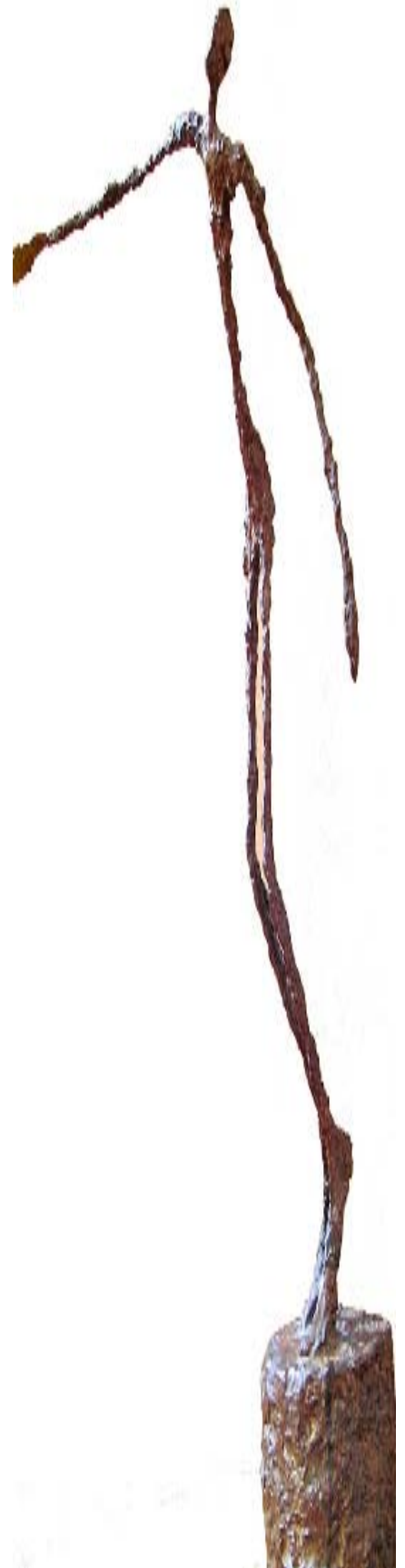
L'homme qui marche, 1960