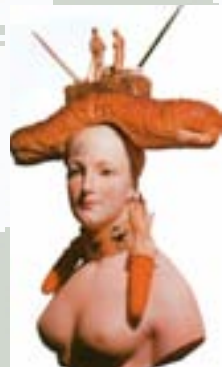
Buste de femme, 1933

12. Parfois il choque: on crie au scandale et on l'accuse ! Salvador Dali est ravi. Ce n'est pas simplement un très grand peintre, c'est aussi un immense comédien qui s'amuse à choquer les gens. Il se fait pousser d'incroyables moustaches et tient des propos révoltants, exprès pour énerver les gens et ... il gagne beaucoup d'argent. On le surnomme « Avida Dollars » qui est l'anagramme de son nom. A sa mort, en 1989, il est immensément riche.