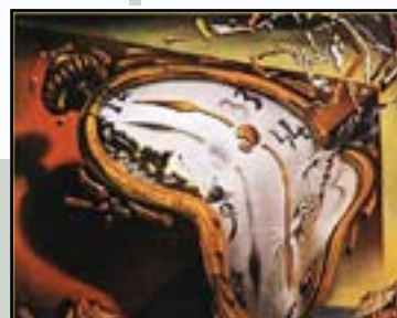
Montre molle, 1931

On trouve par exemple beaucoup de montres molles dans la peinture de Dalí ! Les peintres, qui, comme lui, peignaient des rêves, se sont appelés les « surréalistes ».